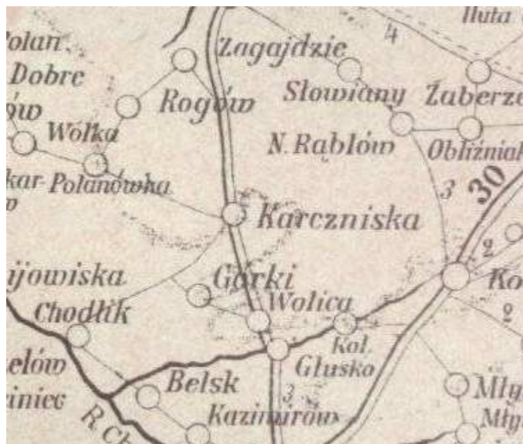
Okolice Karczmisk w 1907 roku.

W takim kształcie gmina Karczmiska przetrwała do wybuchu II wojny światowej.