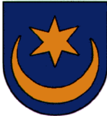
Herb Słotwińskich Leliwa

Spis podatkowy z 1676 roku przekazuje, że w tej wsi mieszkało aż 24 szlachetni urodzonych. Był to więc zaścianek szlachecki pełen małych dworów szlacheckich. Większość z nich nosiła nazwisko Słotwiński ale też kilku nosiło nazwiska: Dmochowski, Lasota, Dłuski, Męcimirski, Wronowski, Samson i Strzelecki.