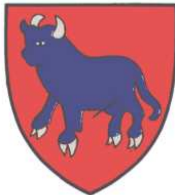
Herb Drzewieckich i Głuskich CIOŁEK